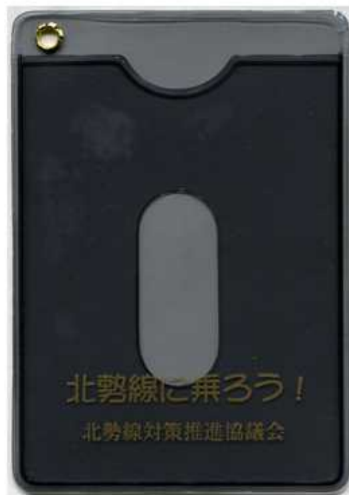
三岐鉄道1日乗り放題バス(左)、バスケース(上)