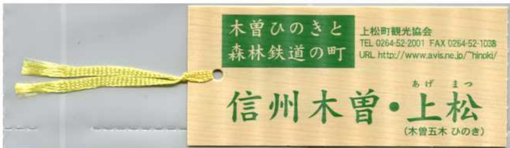
おんたけ交通バス往復乗車券(上松駅前～赤沢自然休養林) ※乗車券切除後